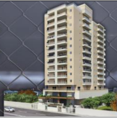
TABELA DE VENDAS